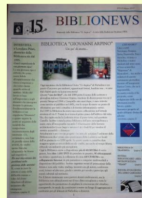
(il giornalino di un anno fa)

E così, quasi senza accorgercene, il 15 Bionews ha compiuto un anno. Per festeggiare abbiamo voluto fare un'intervista particolare: ognuno di noi ha proposto una domanda e insieme abbiamo risposto. Buona lettura e... tanti auguri giornalino!!!