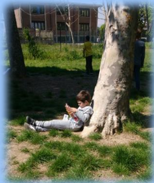
(L'ora di lettura - Giardino della scuola Rodari)

di scuola. Arrivata ormai alla sua seconda edizione, questa potrebbe rappresentare un'interessante proposta da realizzare congiuntamente sul territorio. L'esperienza dell'Ora dedicata alla lettura, nel mese della Festa del Libro, realizzata in altri Istituti Comprensivi è risultata ugualmente positiva. Aule sgombre di banchi e sedie hanno accolto coperte e cuscini per poter leggere comodamente e i giardini delle scuole sono diventati spazi per potersi immergere serenamente tra le pagine di un libro.