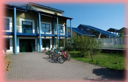
la Biblioteca Civica G. Arpino

Questo la rende un fondamentale presidio di istituzione democratica, garanzia di quella parità e di quell'eguaglianza su cui si costruisce una sana convivenza civile. Oggi come 150 anni fa. Il nuovo progetto della Biblioteca Arpino offre spazi pubblici più ampi per condividere il patrimonio culturale comune, con plurali significati: far crescere la comunità attraverso lo sviluppo di un pensiero critico nato dal confronto e pluralità di punti di vista, aiutando le persone di ogni età e condizione sociale ad accedere ai contenuti digitali.