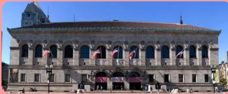
la Boston Public Library

Ma una biblioteca offre a tutti uguale opportunità all'interno della nostra società: finché esisterà una biblioteca in una comunità, dotata di bibliotecari formati e aggiornati, l'accesso individuale alla cultura condivisa non sarà mai determinata da quanto denaro si ha in tasca.