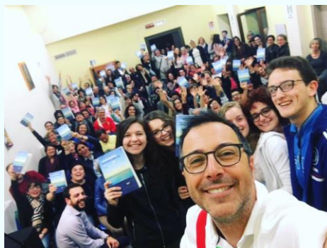
La redazione del 15biblionews