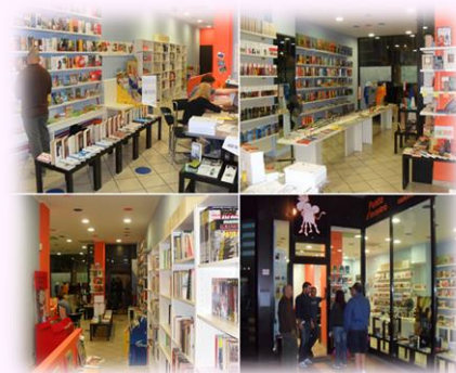
(In alto: Libreria il Cammello di Nichelino)